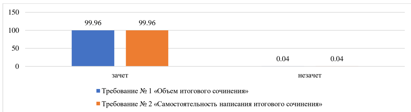
Диаграмма результатов написания итоговых сочинений по общему количеству выставленных оценок «зачет» / «незачет» по каждому требованию

Результаты написания итоговых сочинений по общему количеству выставленных оценок «зачет» / «незачет» по каждому критерию его оценивания